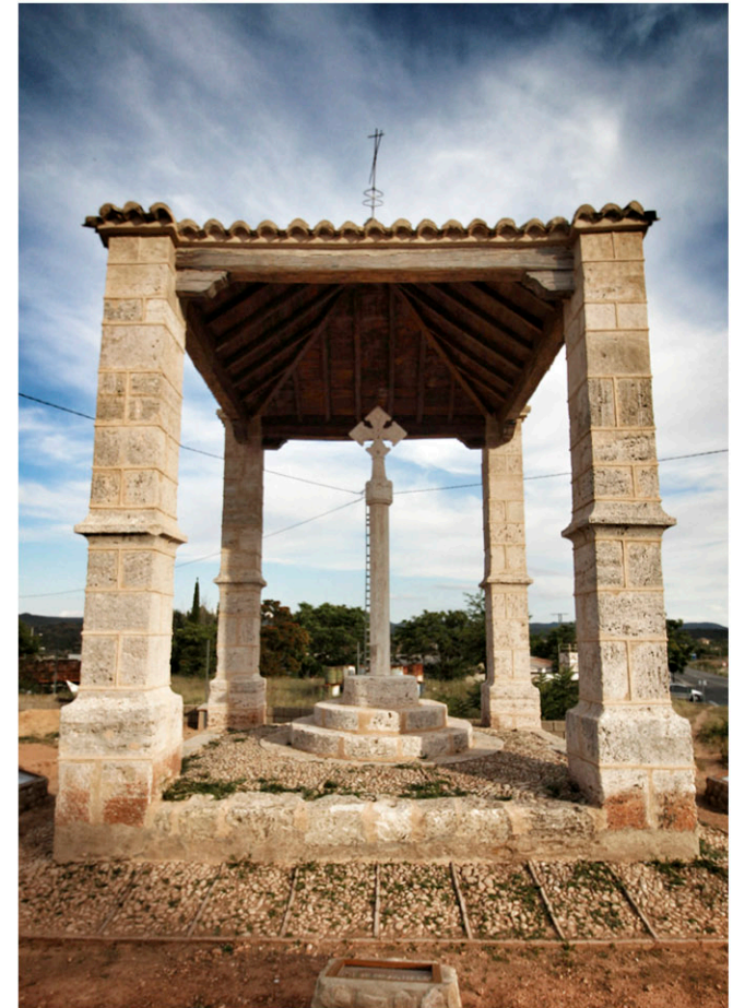
Detalles de la cruz cubierta de Ayora, detalle de la ermita de San Antón e imagen de Miguel Molsós