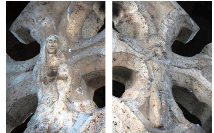
Detalle de la virgen y el cristo labrados en las caras de la cruz

La construcción se asienta sobre una gran base cuadrada de más de 3 metros de lado. Coronando el techo encontramos un antigua veleta.