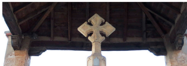
Detalle de la cruz y el capitel

Toda el conjunto está protegido por un edículo o templete cuadrangular, con cubierta de teja a cuatro aguas y vigas de madera sostenidas por cuatro pilares de piedra cuadrados con unos salientes en su parte media. Toda la construcción supera los 5 metros de altura.