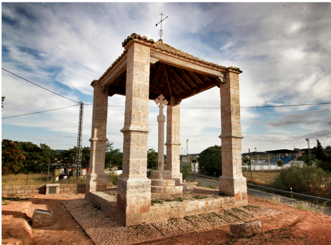
Detalle de la cruz cubierta de Ayora

Estas cruces o humilladeros se erigían por varios motivos: En conmemoración de fechas señaladas o acontecimientos destacables (esta práctica era habitual en el Reino de Aragón); como simple testimonio de piedad cristiana; junto a caminos, monasterios o ermitas; etc.