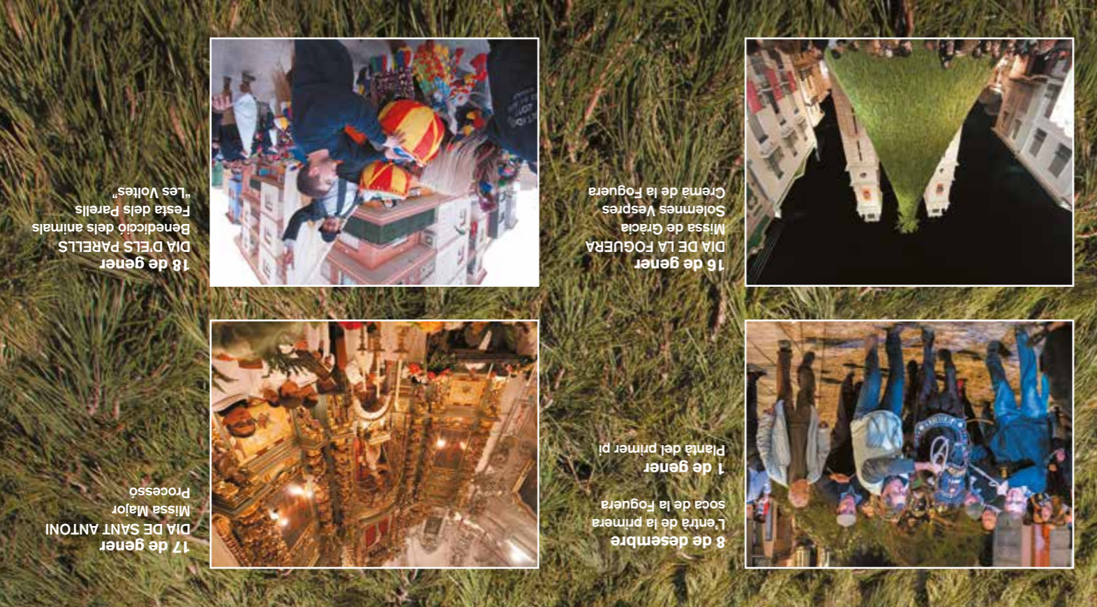
18 de gener DIA D'ELS PARELLS Benedicció dels animals Festa dels Parells "Les Voltes"